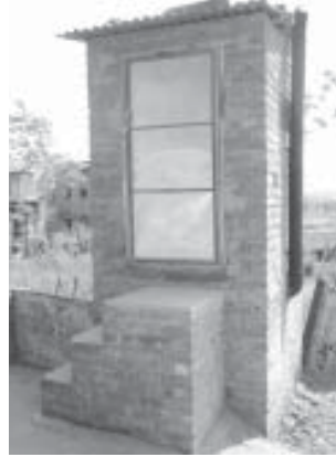
टिगनीमा बनिएको मलचर्पी

मलचर्पी एउटा बेग्लै प्रकारको चर्पी हो, जसमा दिसा र पिसाबलाई स्रोतको रूपमा लिई छुट्टा छुट्टै संकलन गरी सदुपयोग गरिन्छ। 'खेतबाट पेटमा र पेटबाट खेतमा' को अवधारणा बोकेको यो चर्पीले पर्यावरणीय चक्रलाई सन्तुलित बनाई राख्न मद्दत पुऱ्याउँदछ। यति मात्र नभएर खेर जाने पदार्थको सहि सदुपयोग हुने र यसको प्रयोगले माटोको गुणस्तर राम्रो हुने हुनाले मलचर्पीको माग दिनानुदिन बढिरहेको छ। मानिसको दिसामा करोडौंको संख्यामा रोगजन्य जिवाणुहरु हुन्छन् भने पिसाबमा प्रायः हृदैन। त्यसै कारण दिसा र पिसाबलाई नमिसाई छुट्टाछुट्टै संकलन गरी केही समय संग्रह गरेर जिवाणुलाई नष्ट पार्नु आवश्यक हुन्छ। विरुवालाई चाहिने खनिज श्रोत, जस्तै नाइट्रोजन, फोस्फोरस र पोटास, पिसाबमा अत्याधिक हुने र दिसामा कम मात्रै हुन्छ। तर पनि दिसाको मलले माटोलाई खुकुलो बनाई पानी सोस्न सक्ने शक्ति बढाउँदछ। मलचर्पीको अर्को प्रमुख फाइदा यसले पानीको स्रोतहरु प्रदुषण गर्दैन र चर्पीको फोहर व्यवस्थापनको लागि थप खर्च लाग्दैन।