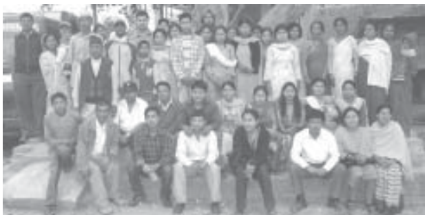
स्थलगत भ्रमण टोलीको समूह फोटो

२०६२ साल १२ महिना १८ गते शुक्रवारको दिन अनुभव आदान प्रदान गराउने उद्देश्यले टिगनी बासीहरूलाई स्थलगत भ्रमण कार्यक्रमको टिगनी सामुदायिक विकास समितिको सक्रियतामा एकीकृत शहरी विकास केन्द्रद्वारा आयोजना गरेको थियो । तालिम कोठाको व्याख्यान भन्दा प्रत्यक्ष हेरेर र उपयोग गरिरहेका मानिस बीच छलफल गरेर बढी कुराहरू बुझ्न र सिक्न सकिन्छ भन्ने अभिप्रायले यो भ्रमण आयोजना गरिएको हो । उक्त भ्रमण कार्यक्रममा टिगनी समुदायका १९ जना पुरुष र १९ जना महिला गरि जम्मा ३८ जनाको सहभागिता रहेको थियो । स्थलगत भ्रमण कार्यक्रम गोफल टोल, म्हयपी र खोकना गरि तीन वटा स्थलहरूमा भ्रमण गराइएको थियो ।