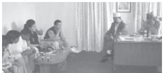
नगरपालिकासँग कार्य योजना बारे छलफल गर्दै