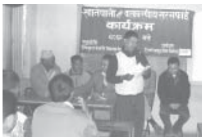
स्वागत मन्त्रव्य व्यक्त गर्दै टिगनी सामुदायिक विकास समितिका सदस्य