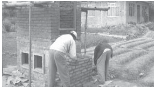
बन्दै गरेको मलचर्पी