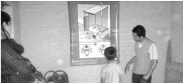
बालबालिकालाई मल चर्पीबारे तालिम

४. अनुभव आदान प्रदानको लागि स्थलगत भ्रमण कार्यक्रम आयोजना गरिएको थियो ।