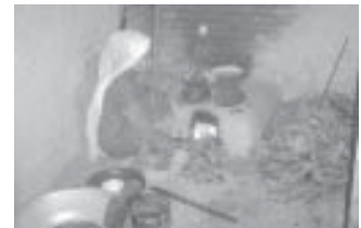
चना, केराउ भुट्टा स्थानीय महिला

टिगनीका प्राय सबै घरमा महिलाहरू विहान र बेलुका धूँवामय चुलो प्रयोग गरिरहेको हुनाले उनीहरूको साथै घरका अन्य सदस्यहरूको स्वास्थ्यमा प्रत्यक्ष र अप्रत्यक्ष रूपमा प्रतिकूल असर परिरहेको हुन्छ ।